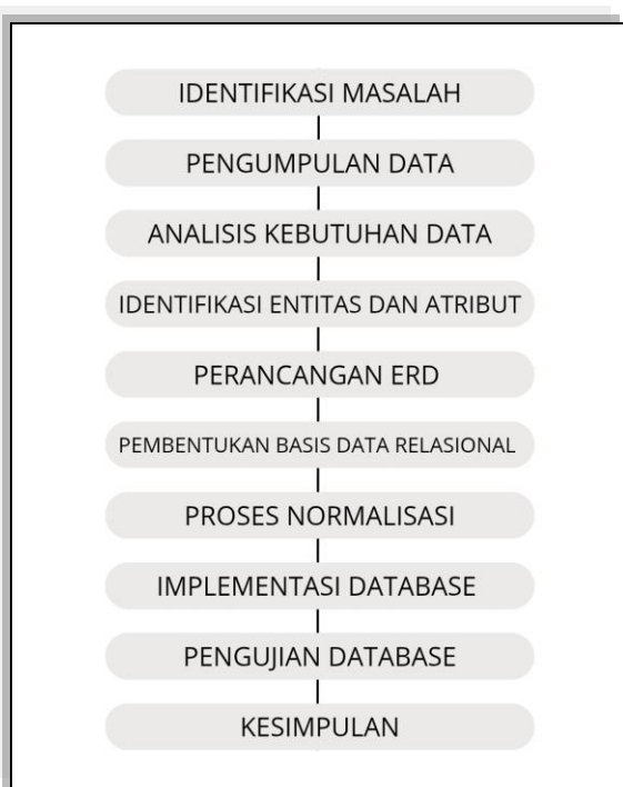
Gambar 1. Diagram Alir Tahapan Penelitian

terorganisir, mengurangi redundansi data, serta memudahkan pengelolaan data yang sesuai dengan kebutuhan sistem e-commerce . Adapun tahapan penelitian yang dilakukan dapat dilihat pada gambar berikut.